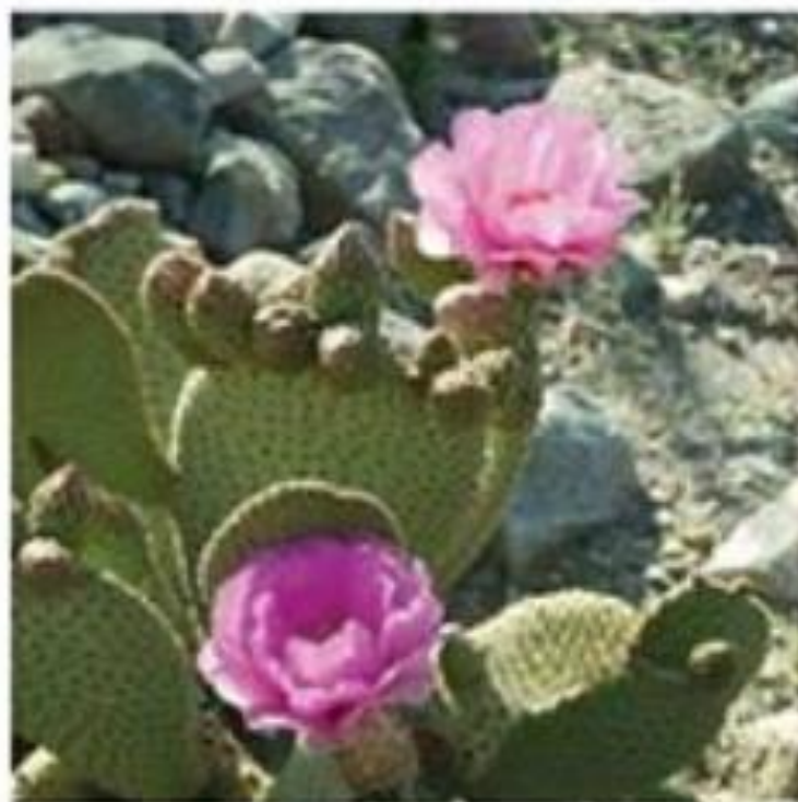
Beavertail Cactus Opuntia basilaris

This prickly pear is the most common cactus in the park.