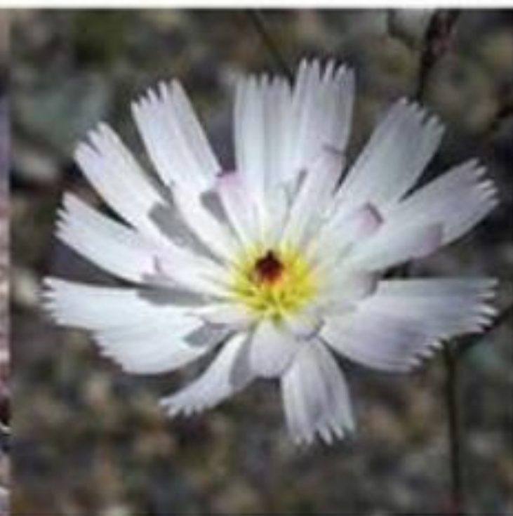
Gravel Ghost Atrichoseris platyphylla

Grows like a Mojavea, but bright magenta flowers.