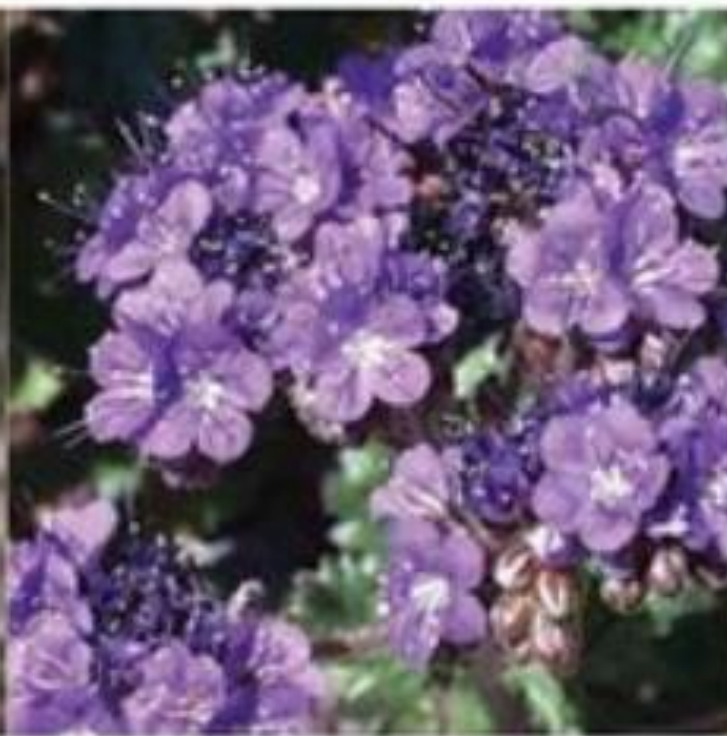
Notch-leaf Phacelia Phacelia crenulata

White flowers open in the evening, fade to pink next day.