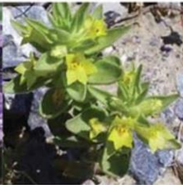
Lesser Mojavea Mojavea breviflora

Do not touch phacelias, they cause a skin rash.