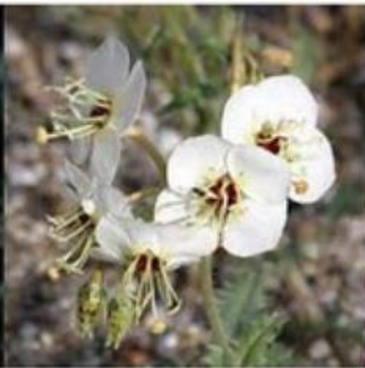
Brown-eyed Evening Primrose Camissonia claviformis

Most abundant yellow flower on the valley floor.