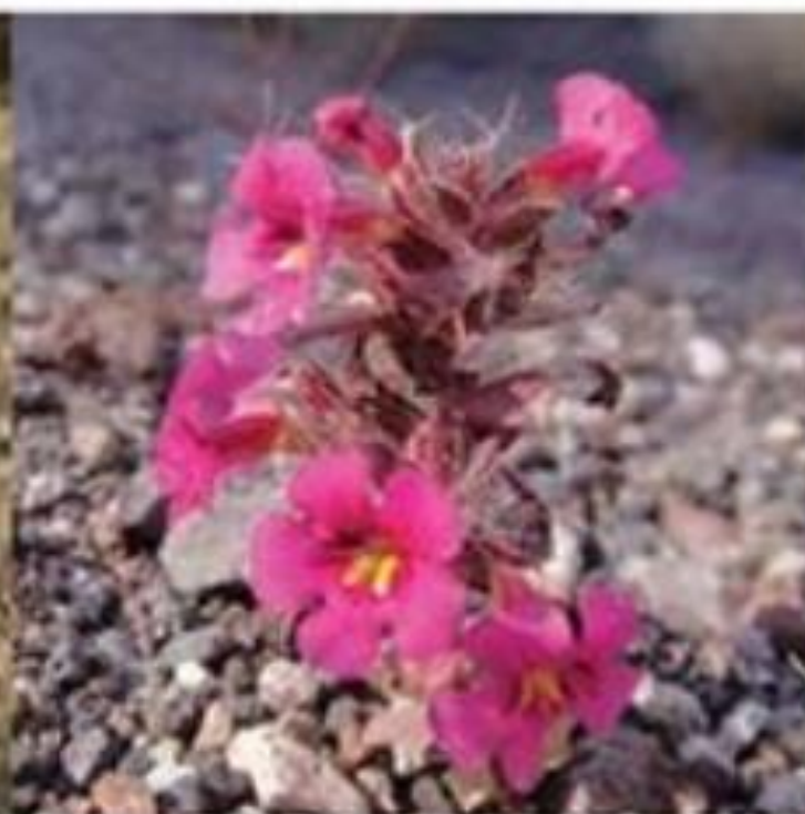
Bigelow Monkeyflower Mimulus bigelovii

Grows like a Mojavea, but bright magenta flowers.