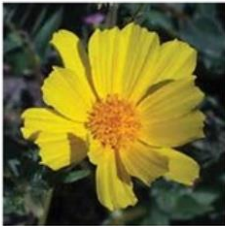
Desert Gold Geraea canescens

Most abundant yellow flower on the valley floor.