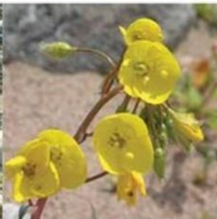
Golden Evening Primrose Camissonia brevipes

This prickly pear is the most common cactus in the park.