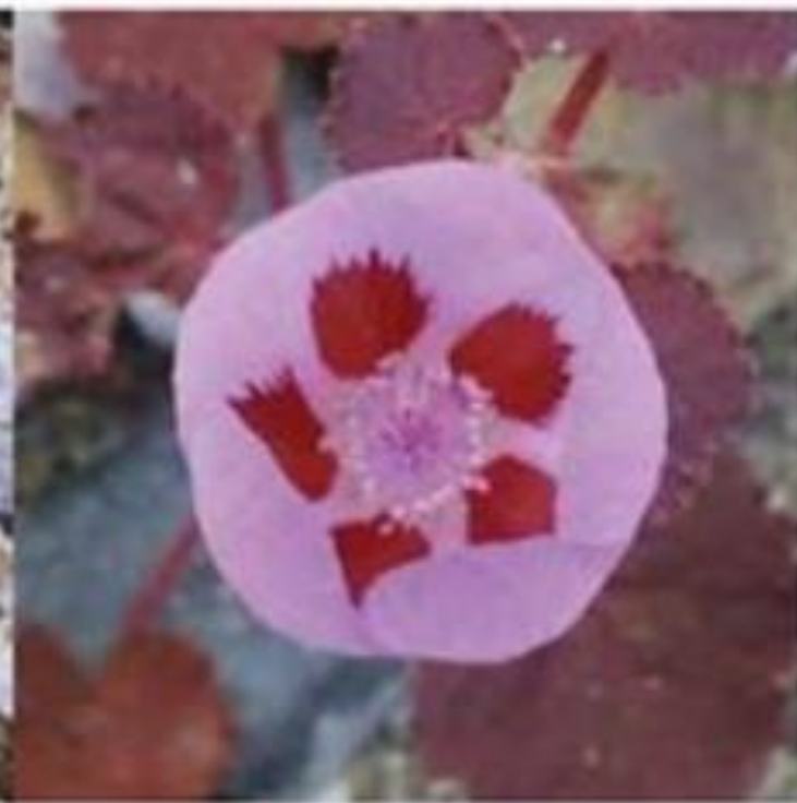
Desert Five-spot Eremalche rotundifolia

Lemon-yellow flowers peek out from among leaves.