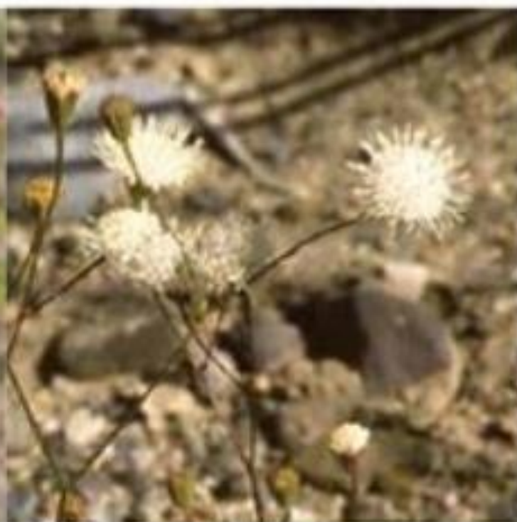
Pebble Pincushion Chaenactis carphoclina

Most abundant yellow flower in mid-elevations